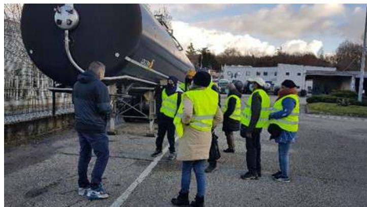
↑↑ Visite d'entreprise à Coralis ↓↓

Nous avons commencé les visites d'entreprises. La pre-