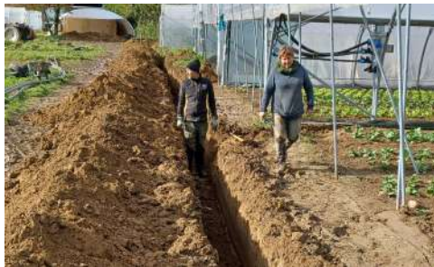
Tranchées pour l'installation de l'irrigation

Dans un 1er temps, cela nous permet de gérer les rotations de cultures plus convenablement et mettre au repos certaines parcelles cultivées depuis 20 ans déjà... Le hangar nous offre une plus grande capacité de stockage des légumes