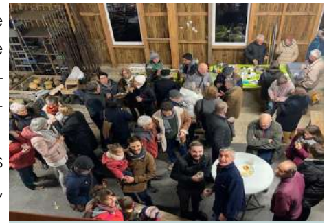
Photo prise lors d'une soirée bénévoles dans le hangar de la Plaine