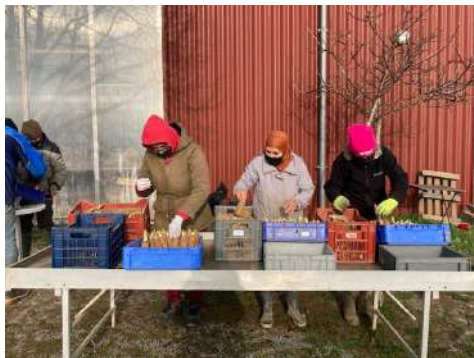
Mise en caisse des racines d'endives

Elles doivent toujours avoir de l'eau à absorber et au bout de 3 semaines on peut déguster nos belles endives...si celles-ci n'ont pas attrapé de méchantes maladies, car la culture des endives est délicate !