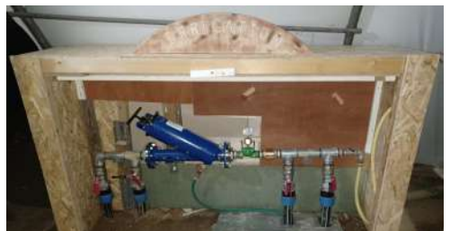
Tableau d'irrigation automatisé !

La centrale de production photovoltaïque est désormais installée sur les toits des anciens bâtiments et produit de l'électricité dé carbo-